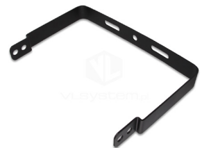
Uchwyt do lampy High bay PPK-150W (Index2352)