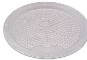
Soczewka 60° do lamp High bay LEP (Index 1940)